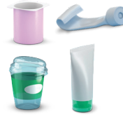
Kubeczki i tubki