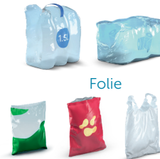
Worki i torby