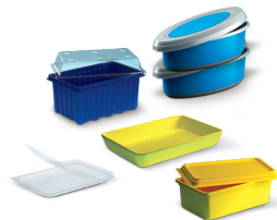
Tacki i misczki